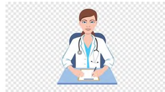
Врач общей практики