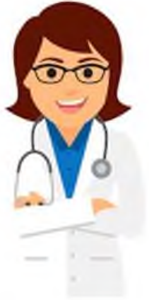
Врач-терапевт (терапевтическое отделение)