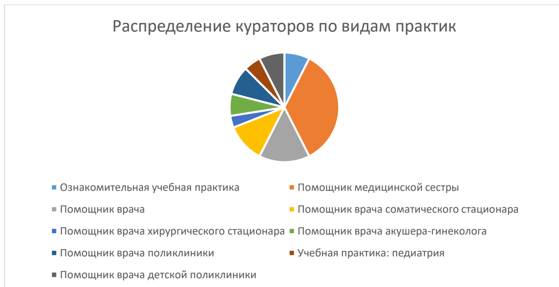
Рис.2 Количество кураторов и виды курируемых практик.

Средний стаж работы по специальности в медицинских организациях составил 18 лет.